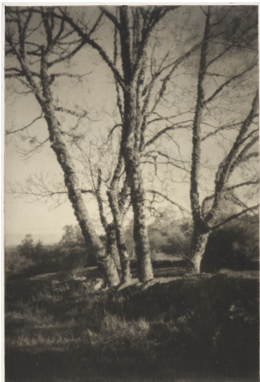
Arbre I, sténopé, 36 cm x 24 cm, 2015