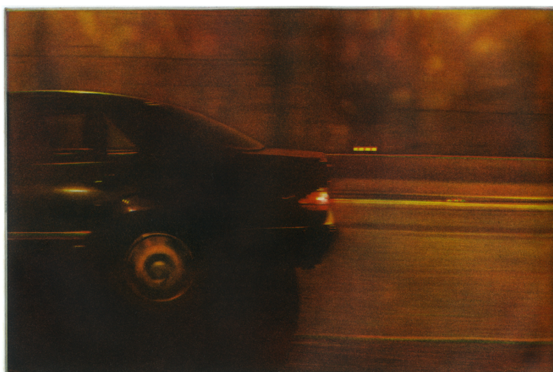
Route III, trichromie, 20 cm x 30 cm, 2017