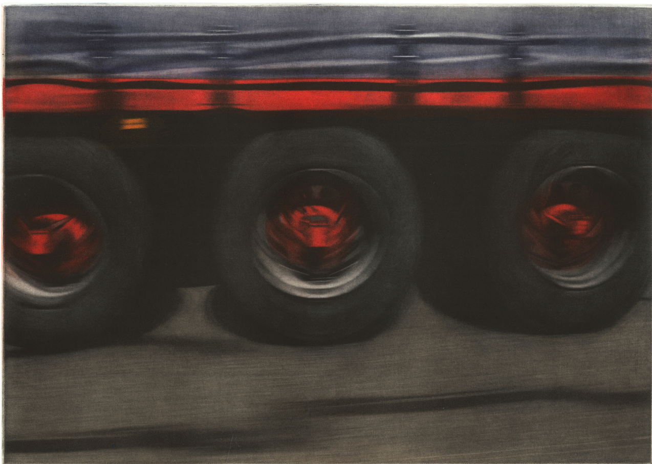
Route I, manière noire, 20 x 30 cm, 2015