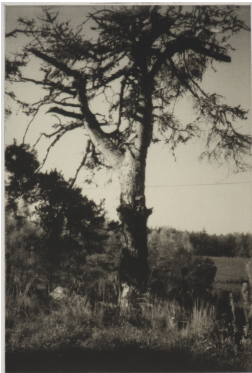
Arbre V, sténopé, 36 cm x 24 cm, 2015