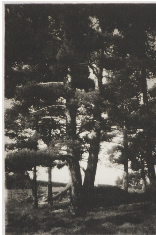
Arbre VII, sténopé, 36 cm x 24 cm, 2015