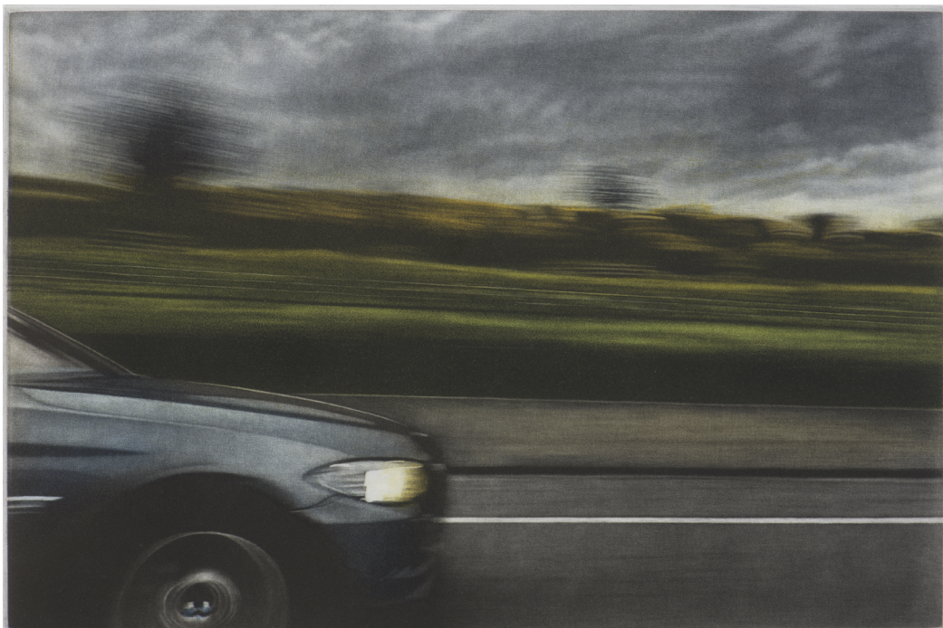
Route II, manière noire, 20 cm x 30 cm, 2016

Elle livre une image suspendue dans le temps.