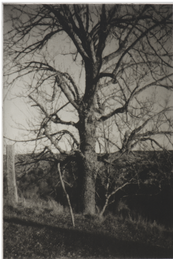
Arbre IV, sténopé, 36 cm x 24 cm, 2015

L'archaïsme du sténopé, la lenteur et la complexité du processus d'élaboration de l'image sont à l'opposé de l'instantanéité et de la précision de la prise de vue numérique. Ce procédé de prise de vue, la plaque polymère sur laquelle est gravée l'image, l'impression en taille douce qui s'ensuit situent l'oeuvre de l'artiste entre photo et gravure.