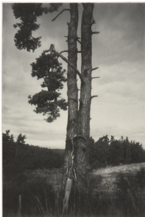
Arbre IX, sténopé, 36 cm x 24 cm, 2016