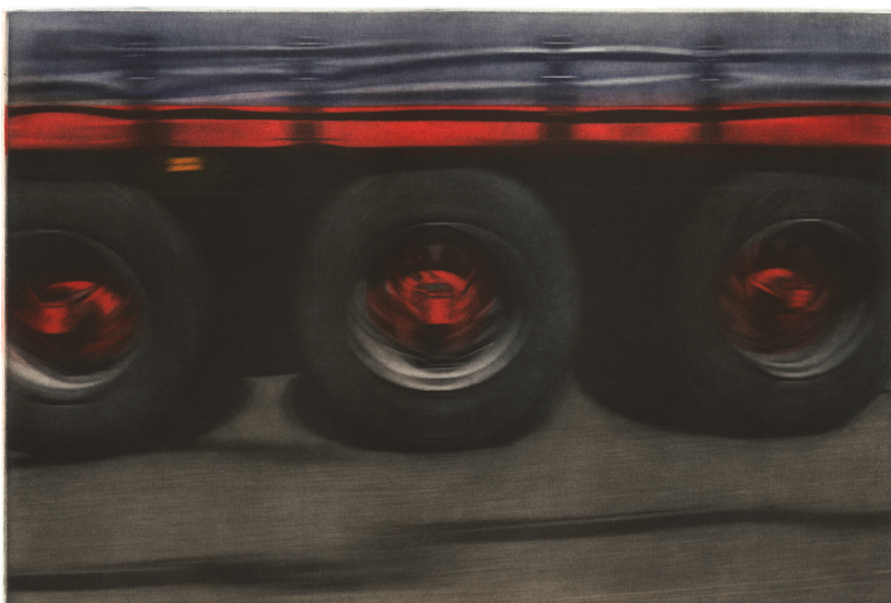
Route I, manière noire, 20 x 30 cm, 2015