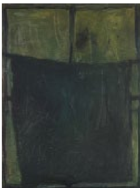
Rideau devant une fenêtre au reflet vert, 2011. Huile sur toile, 130 x 97 cm.