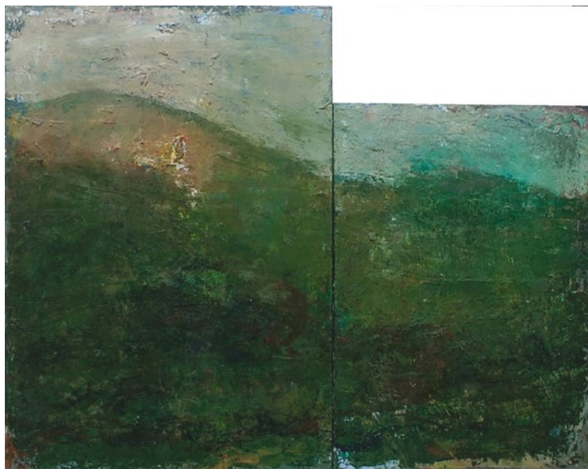
2022/7 – Paysage (diptyque), 2022. Huile sur toile, 116 x 146 cm