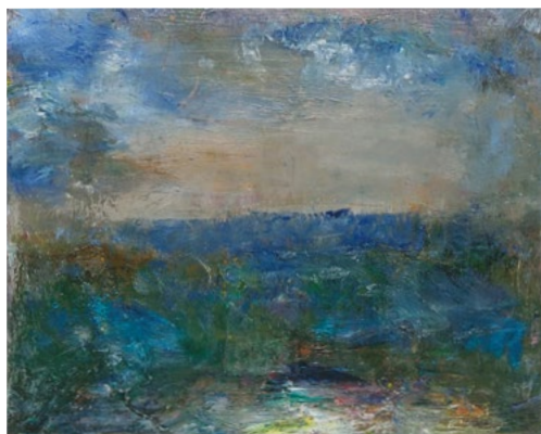
2021/24 – Paysage, 2021. Acrylique sur toile, 46 x 55 cm.