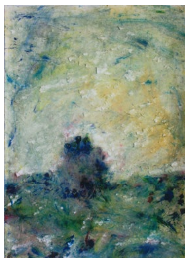
2022/10 – Arbre, 2022. Acrylique sur papier, 76 x 55 cm.