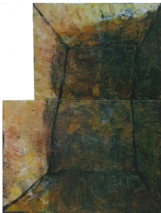
2022/71 – Lieu vide (diptyque), 2023. Acrylique sur toile, 119 x 92 cm.