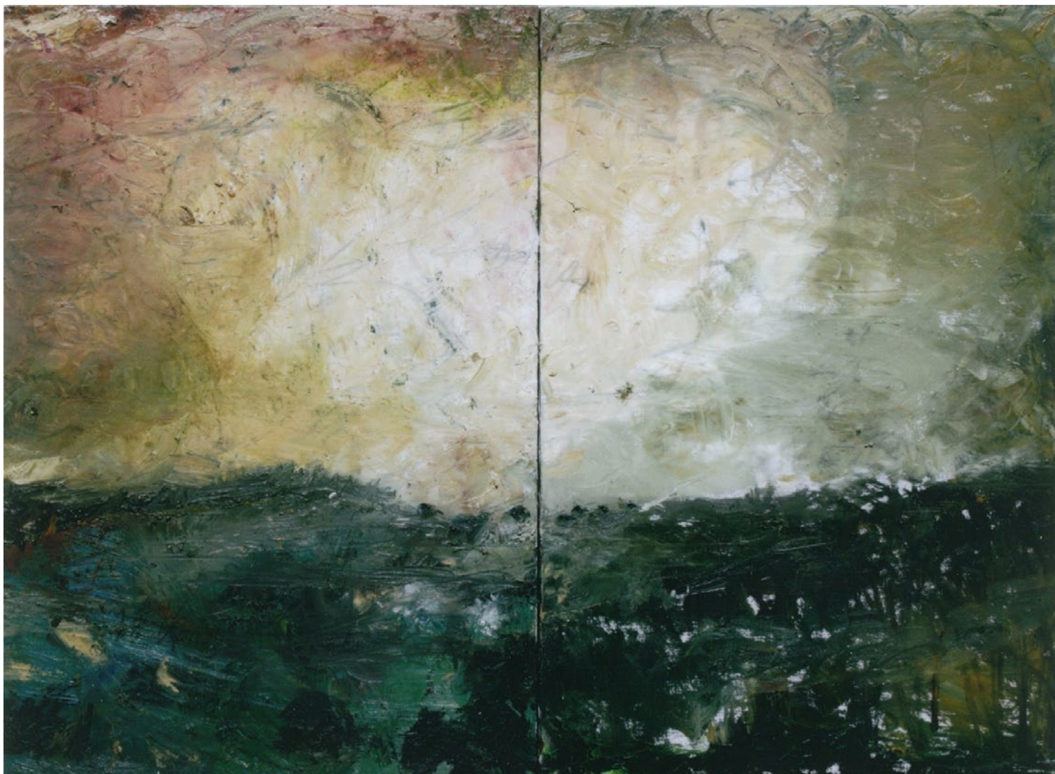
2023/6 – Ciel et sol en mouvement (diptyque), 2023. Huile sur toile, 116 x 178 cm.