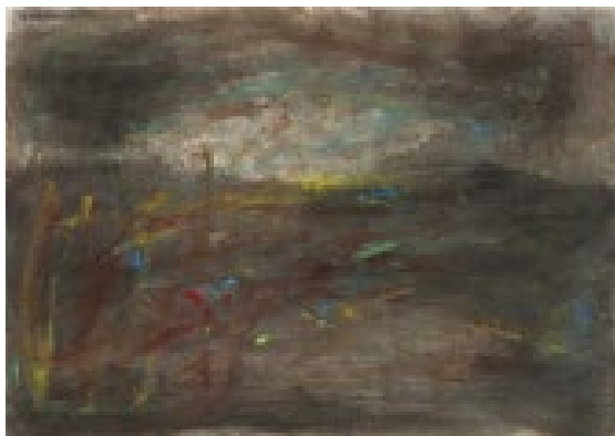
Paysage, 2013. Technique mixte sur papier. © François Pons