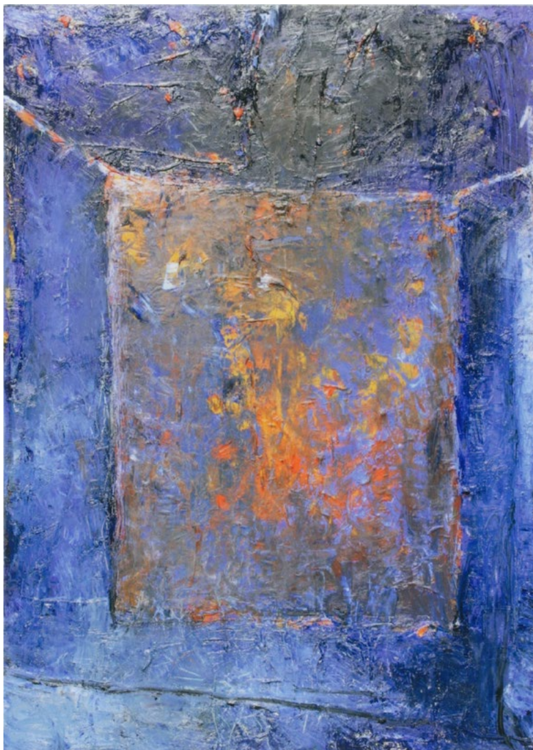
2023/7 – La grande bleue au tissu suspendu, 2023. Huile sur bois et tissu, 162 x 114 cm.