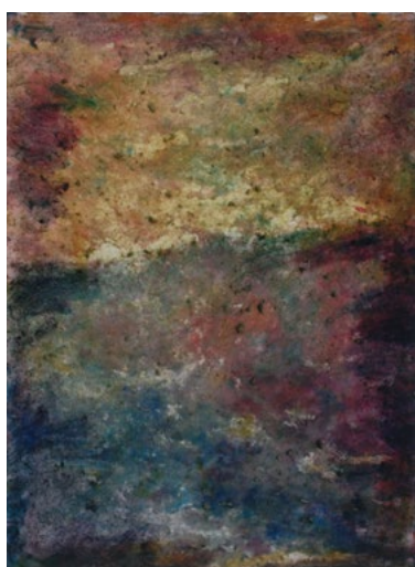
2022/11 – Paysage, 2022. Acrylique sur papier, 76 x 55 cm.

A partir du 18 janvier 2024, la galerie Univer présentera les œuvres les plus récentes de Marc Ronet, paysages, lieux et fleurs, peintures, dessins et gravures. Le travail de Marc Ronet est présenté tous les deux ans depuis 2010 en exposition solo à la galerie.