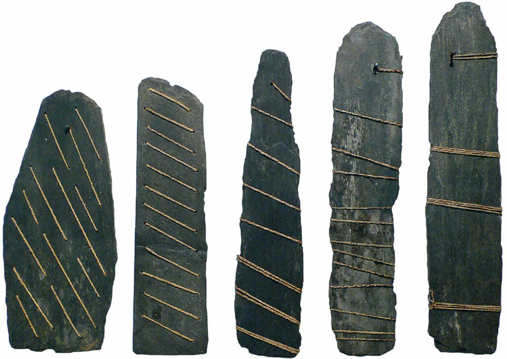
Marinette Cueco, Ecritures (1993) et Enroulement (1994). Jonc capité tressé et Ardoise d'Allasac