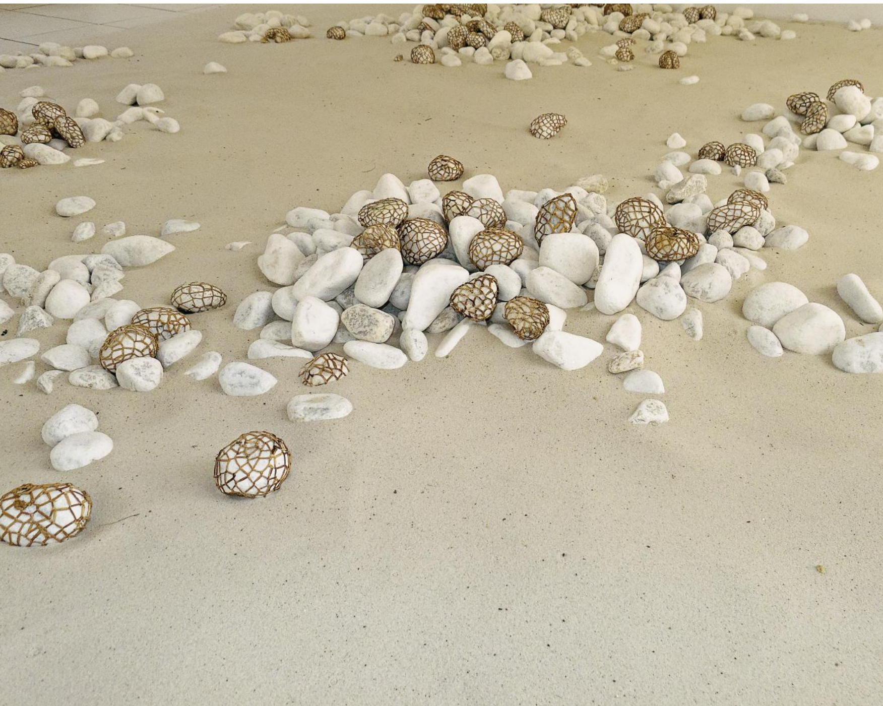
Marinette Cueco, Pierres captives , 1995. Jonc capité, galets de marbre, sable de Fontainebleau