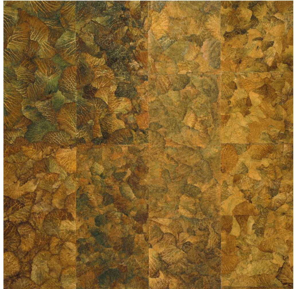
Marinette Cueco, Grand herbier , 2005. Chou frisé, 200x200cm

La pratique de l'herbier se décline également sous la forme de petits tableaux carrés, chacun dédiés à une espèce présentée en un maillage dense. Les herbiers témoignent d'une maîtrise du séchage des feuilles et d'un art de la composition remarquable, qui sont le fruit de plusieurs décennies de recherches et d'expériences. Ses œuvres sont autant de microcosmes où le regard peut se perdre, et l'âme se régénérer.