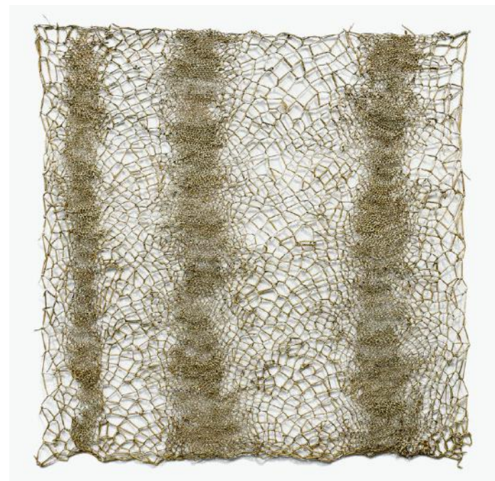
Marinette Cueco, Entrelacs , 50x50 cm 2015 Jonc capité

Gilbert Lascault explique à propos de son travail : « Les seuls outils qu'elle se permet sont une pince de philatéliste (pour manipuler les fibres très fines) et une paire de ciseaux. Si elle refuse la plupart des outils, c'est pour ne pas adopter les « tours de mains », liés à la forme de tel ou tel instrument ; c'est pour découvrir des gestes nouveaux, produisant des graphismes inattendus, d'imprévisibles entrelacs. » [Extrait du catalogue d'exposition Herbes , musée d'Art moderne de la Ville de Paris, musée des Enfants, 1986]