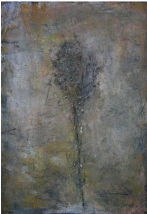
« Fleur », 2020. Acrylique et craie sur papier, 70 x 50 cm.