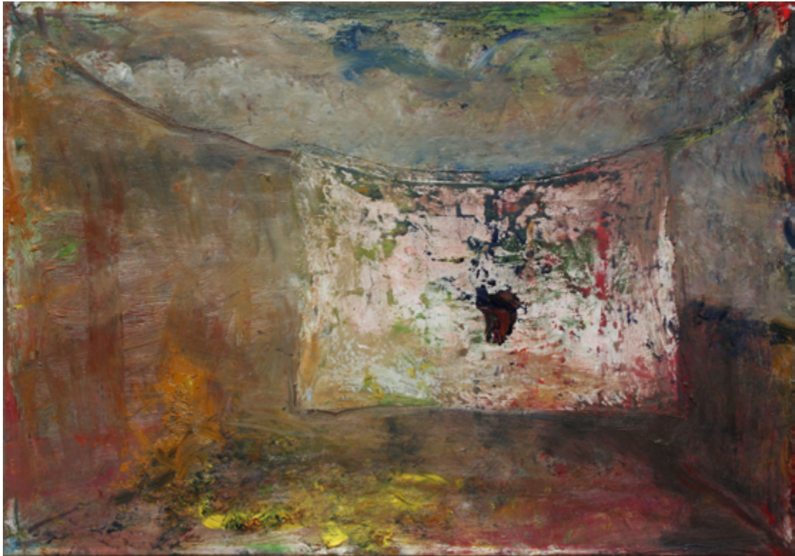
« Linge blanc dans un paysage », 2021. Huile sur toile, 81 x 116 cm.