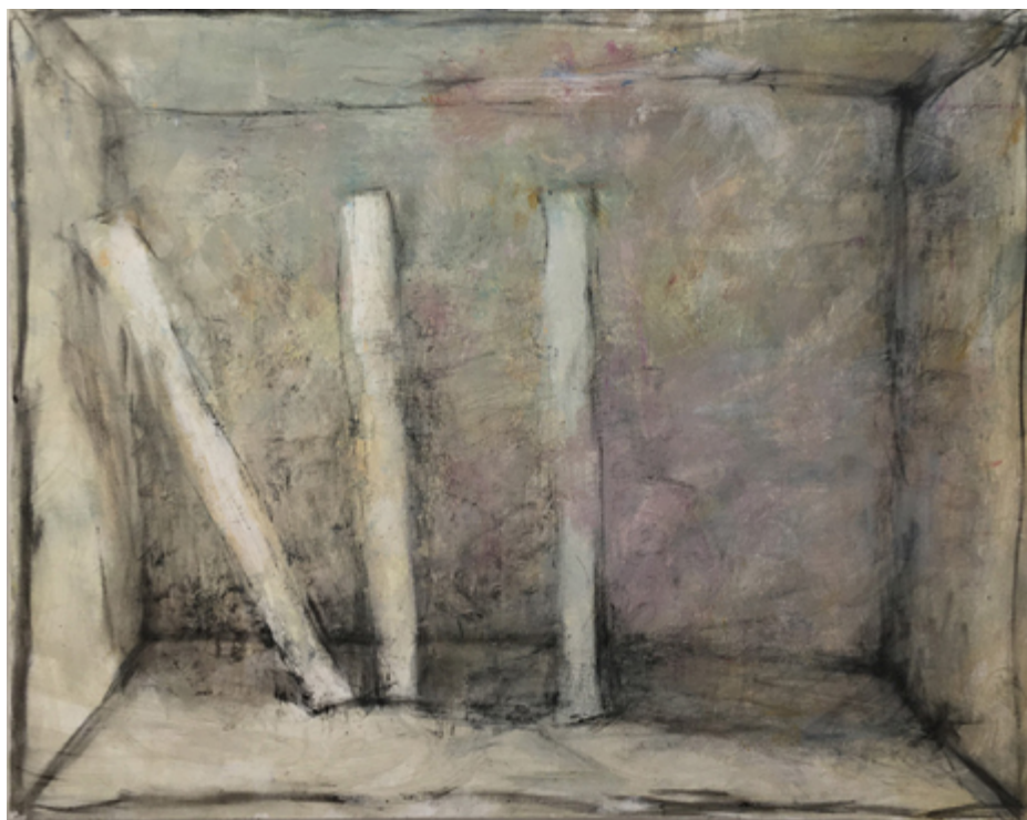
« 3 Bâtons dans un Lieu », 2020. Huile sur toile, 81 x 100 cm.