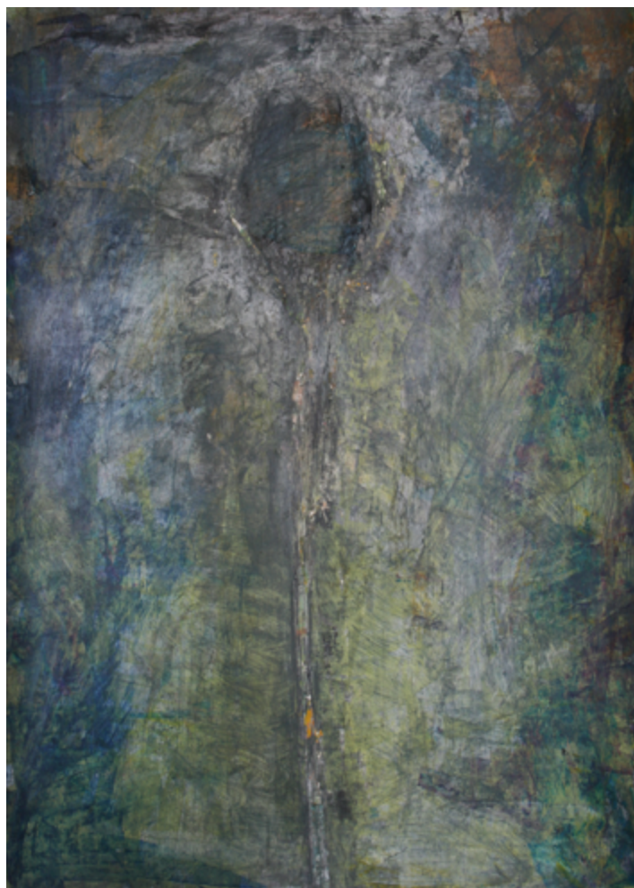
« Fleur », 2020. Acrylique et craie sur papier, 70 x 50 cm.