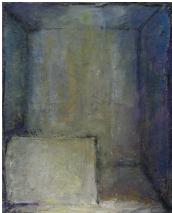
« Forme dans un lieu vide », 2021. Huile sur toile, 100 cm x 81 cm.