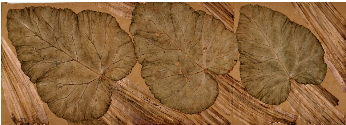
Herbier - Rhem Raponticus - rhubarbe, 45 x 125 cm, 2008 - Photo : © David Cueco