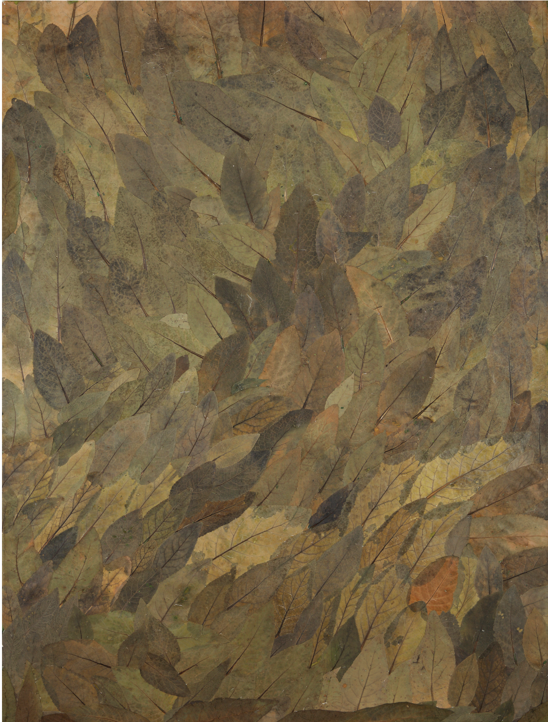
Herbier - Symphytum Officinale - Consoude, 180 x 135 cm, 2007 - Photo : © Bertrand Hugues