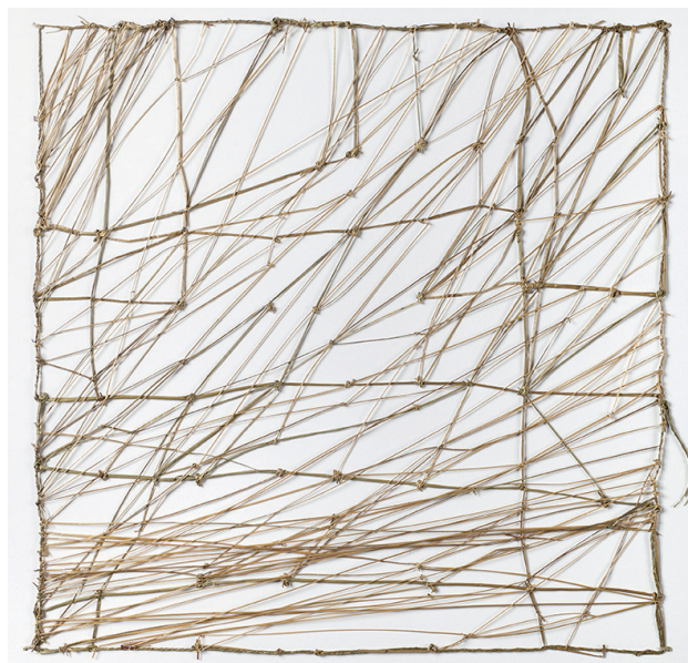
Entrelacs - carex, 2014. 50 x 50 cm.