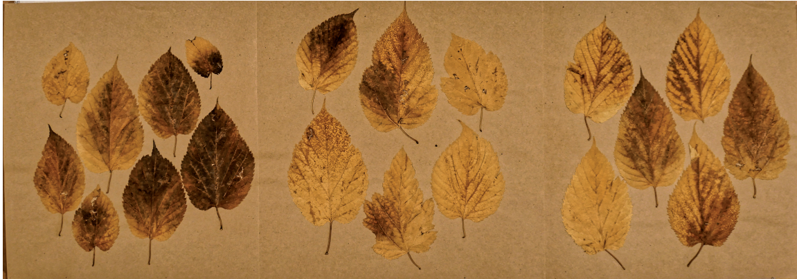
Herbier - Tilia Platyphyllos - tilleul blanc, 45 x 128 cm, 2006