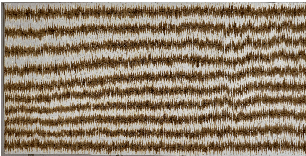
Herbier - Bignona Catalpa- Photo : © David Cueco