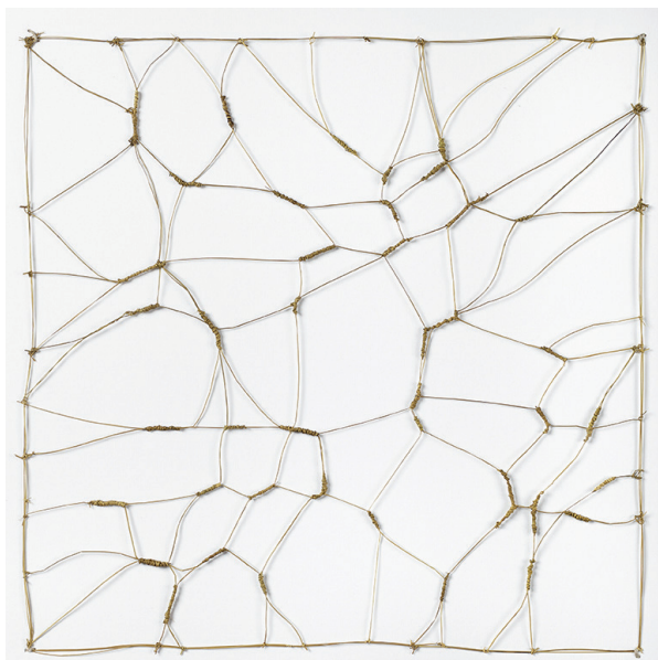
Entrelacs - Juncus capitatus, 2015, 50 x 50 cm