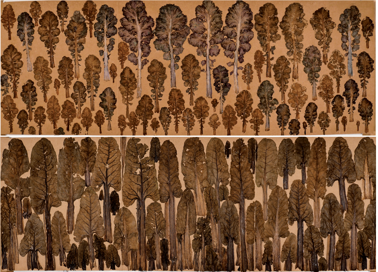
Crambe Maratima - chou marin, 45 x 128 cm, 2008 Brassica rapa - chou rave, 45 x 128 cm, 2007