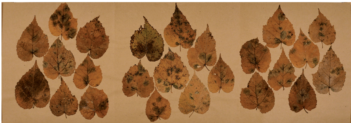
Herbier - Morus Alba murier blanc, 45 x 128 cm, 2006