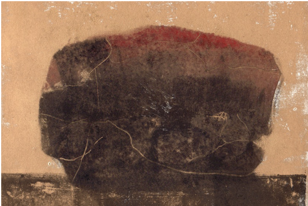
La pierre rouge, monotype, 33 x 25 cm, 2016