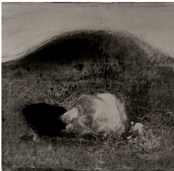
Duo, monotype, 25 x 32 cm, 2014