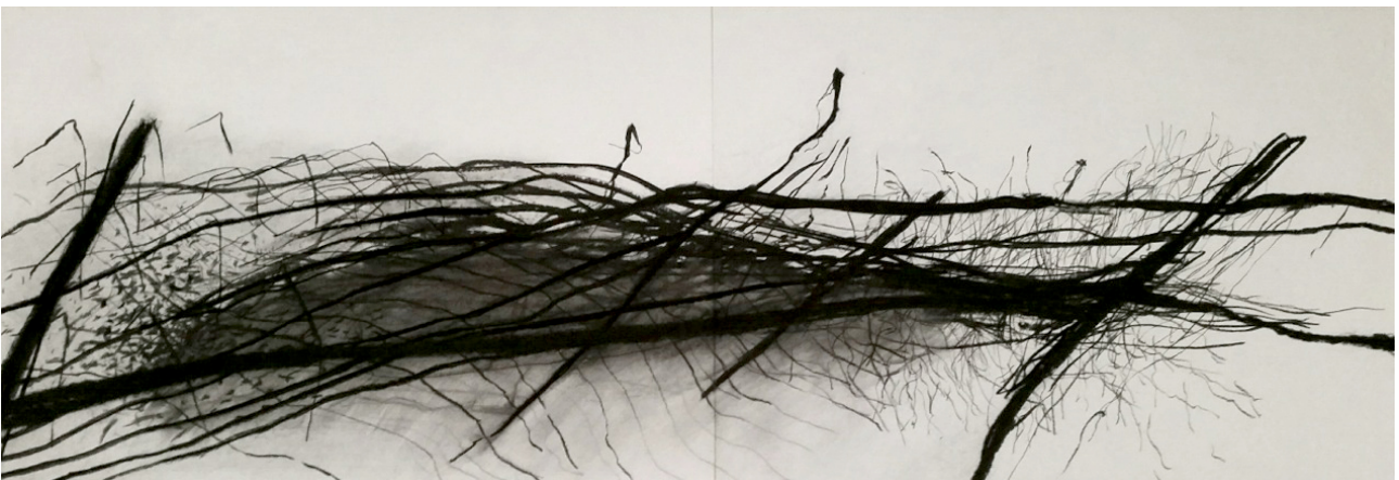
Energie végétale 2, fusain sur papier, 56 x 152 cm, 2017