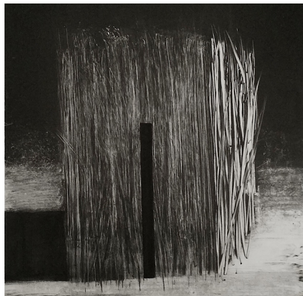
Etroit impossible, monotype, 56 x 76 cm, 2016

« La lumière me donne à voir le monde comme au théâtre » dit Jean-François Baudé. Et pour capter cette lumière Baudé dessine et réalise des monotypes. Le monotype, est un procédé d'impression sans gravure qui produit un tirage unique. Il s'agit de « peindre » avec une encre grasse, sur un support non poreux comme, du métal ou du plexiglas. « La peinture » est ensuite passée sous presse sur un papier spécial qui reçoit l'épreuve, le monotype n'est pas une gravure au sens strict, mais une estampe. L'exposition présentera principalement des monotypes ainsi que des dessins au fusain et aura lieu du 29 mars au 22 avril 2017.