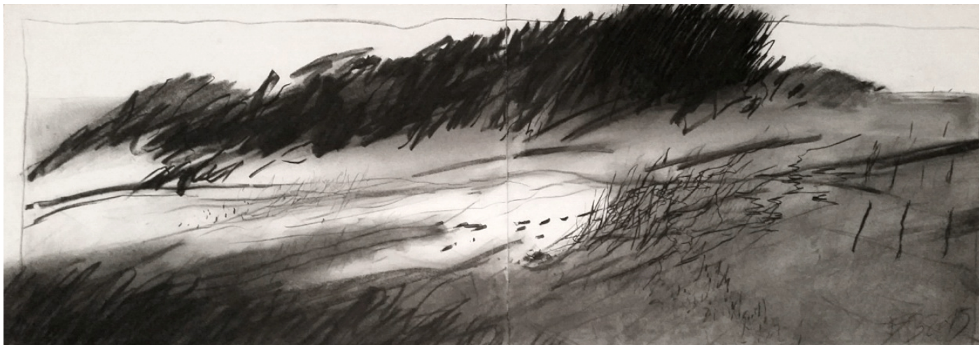
Paysage, fusain sur papier, 56 x 152 cm, 2015