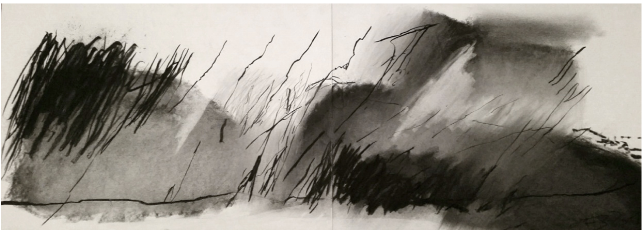
Entre, fusain sur papier, 56 x 152 cm, 2015

Une lenteur et le fantôme du noir Recherche paysage Recherche ventilation Ne veut plus trace du monde Voudrait bien toucher ciel Et voudrait se poser Et cherche aération