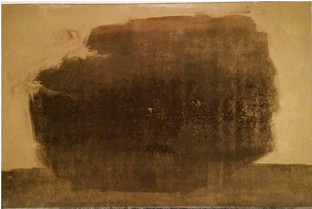
Posée là, monotype, 56 x 76 cm, 2016