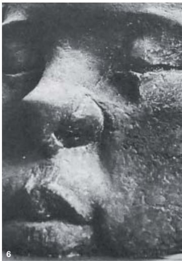
6 J.F BRIANT 70 x 70 x 80 cm