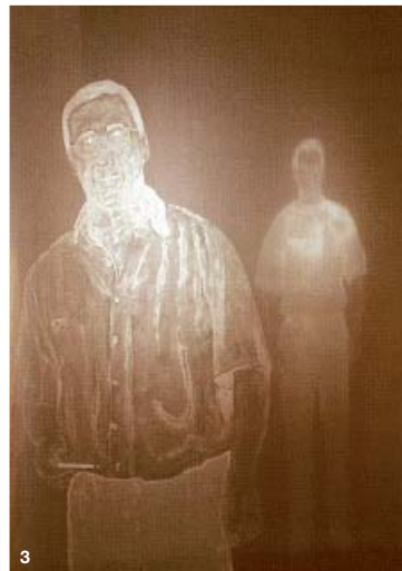
3 J.M CERINO 100 x 200 cm