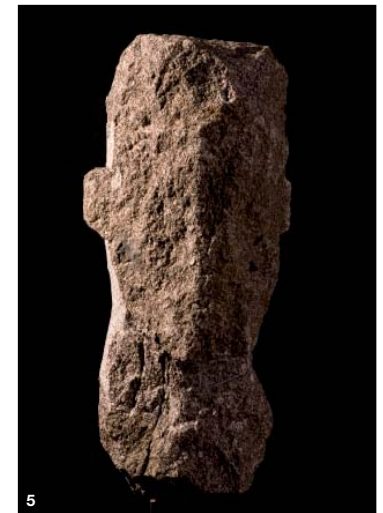
5 D. MONFLEUR 175 x 40 x 40 cm