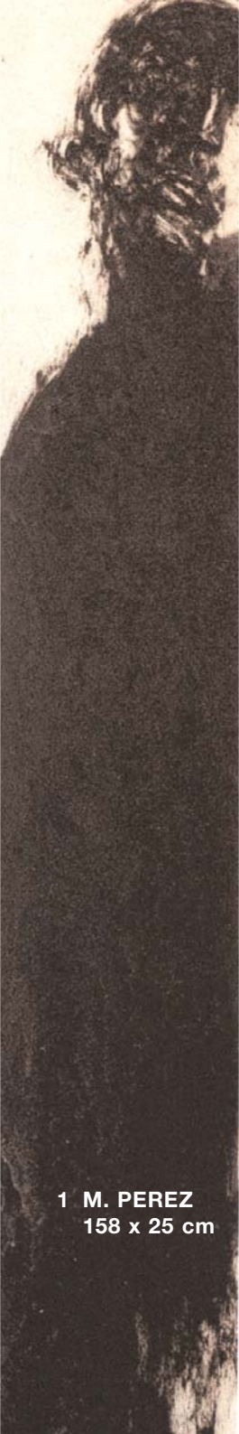
1 M. PEREZ 158 x 25 cm