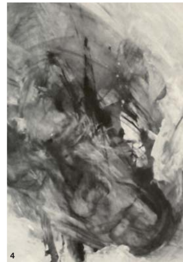
4 P. SZUREK 79.5 x 77 cm