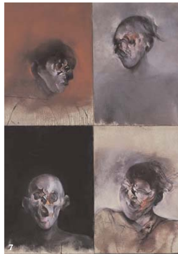
7 V. VELICKOVIC 253 x 660 cm