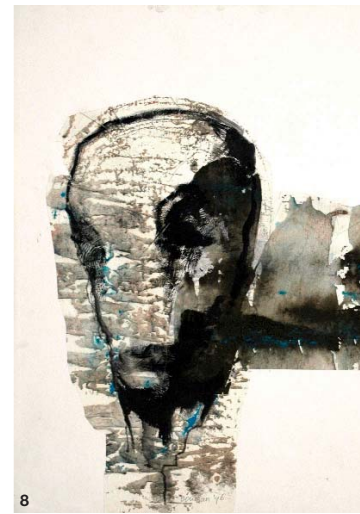
8 H. BOUMAN 65 x 50 cm