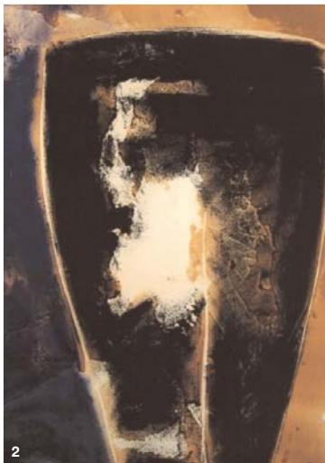
2 LAURENT ROYER 116 x 89 cm